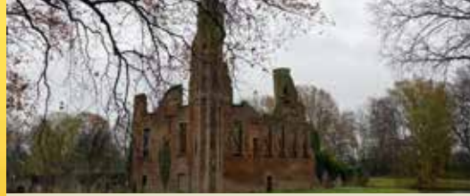
Goed nieuws voor kasteelruïne Ter Elst (p. 2)