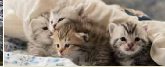
N-VA Duffel heeft een hart voor dieren (p. 3)