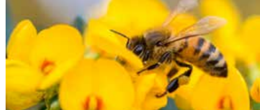
Duffel is bij-vriendelijke gemeente p.3