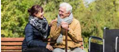
Veranderingen in OCMW en woonzorgcentrum p.2