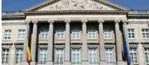
Bezoek de parlementen met Sofie &amp; Rita p. 2