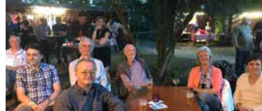
Het zomert (nog na) bij N-VA Duffel p. 3