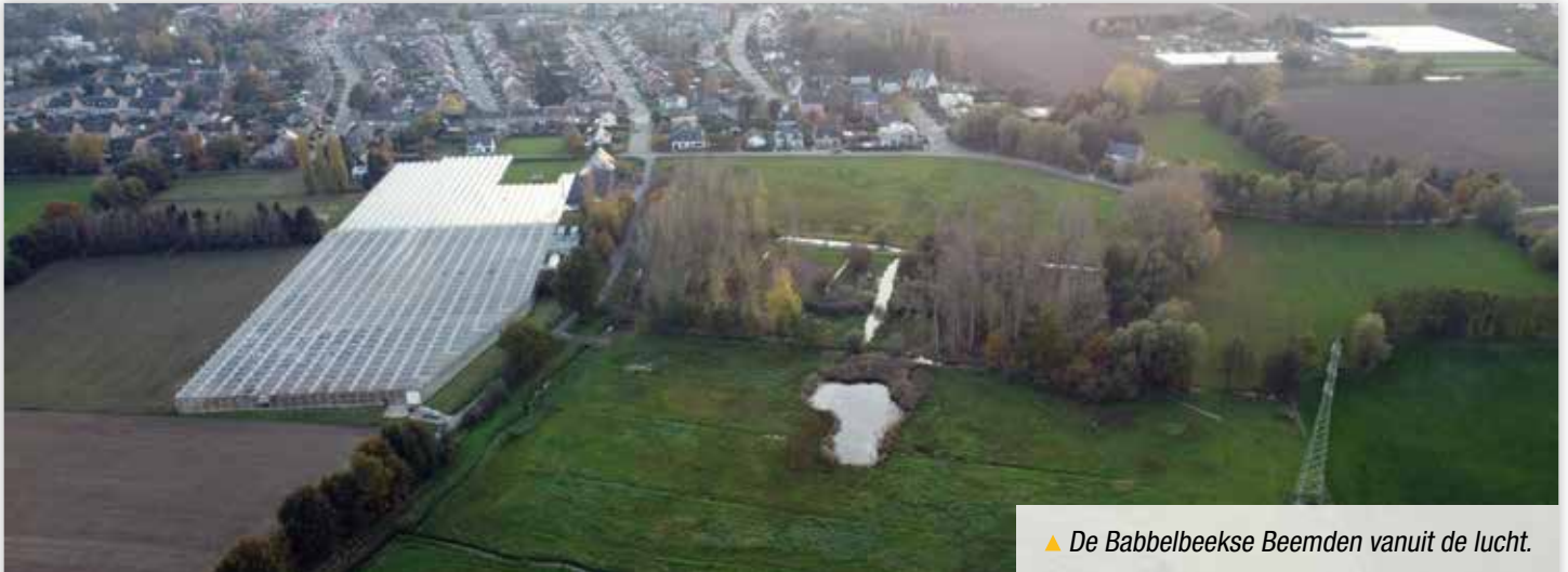
▲ De Babbelbeekse Beemden vanuit de lucht.