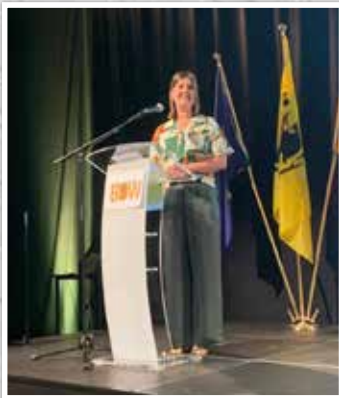
◀ Onze burgemeester als gastvrouw bij 'Op tournee met BDW'.