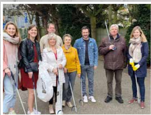
◀ Enkele bestuursleden maakten de Duffelse straten mee proper tijdens de lenteschoonmaak.