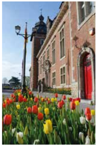
◀ Duffel zet de bloemetjes buiten, met dank aan onze groendienst.