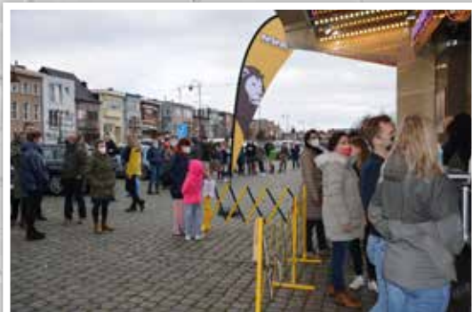
◀ Onze nieuwjaarsactie werd gesmaakt. We deelden meer dan 1.000 smoutebollen uit.