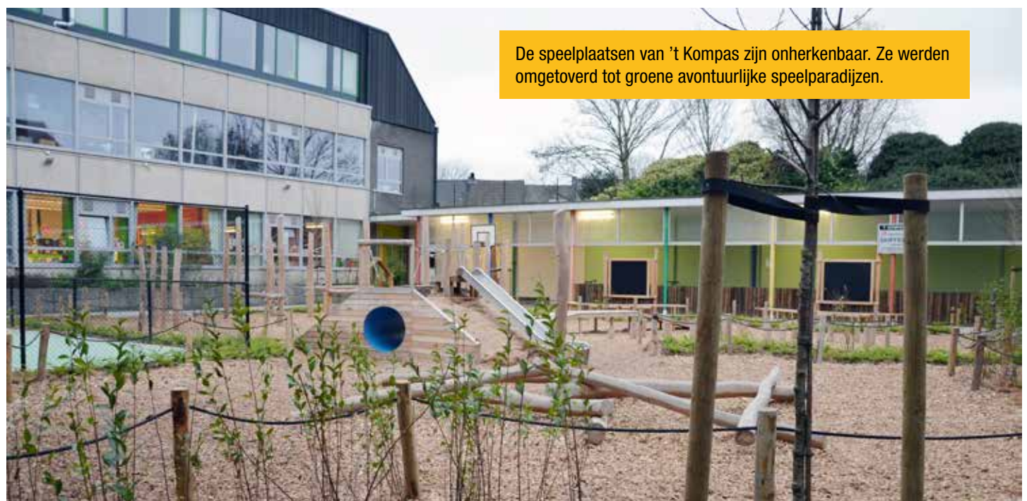
De speelplaatsen van 't Kompas zijn onherkenbaar. Ze werden omgetoverd tot groene avontuurlijke speelparadijzen.