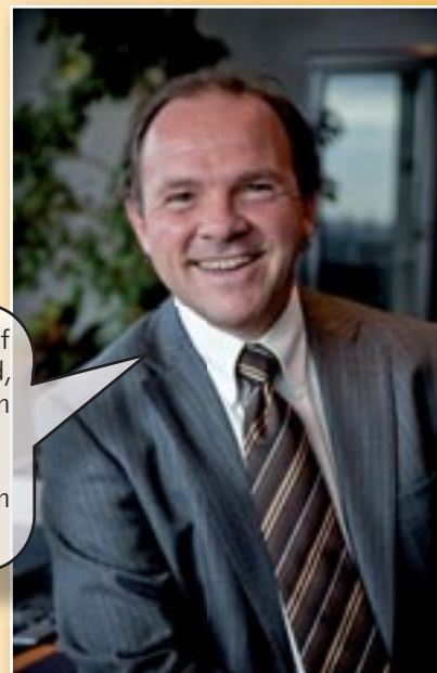
Philippe Muyters, Vlaams minister van Begroting

Vlaanderen zal géén extra besparingen opleggen om de putten in de federale begroting te dichten.